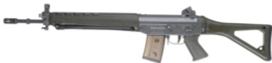
vue de gauche