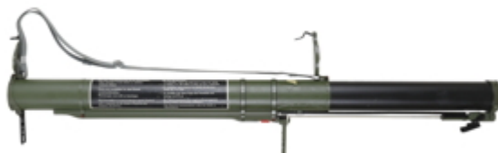
vue de droite