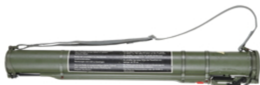
vue de gauche