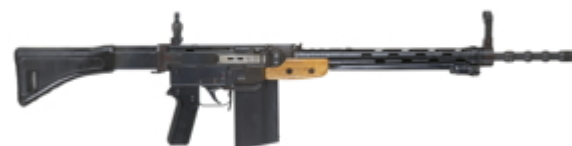
vue de droite