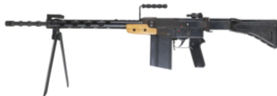
vue de gauche