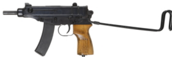
vue de gauche, crosse dépliée