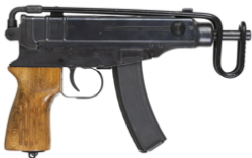
vue de droite