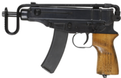
vue de gauche, crosse pliée