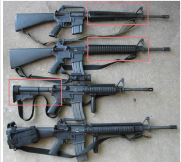
comparaison entre des modèles