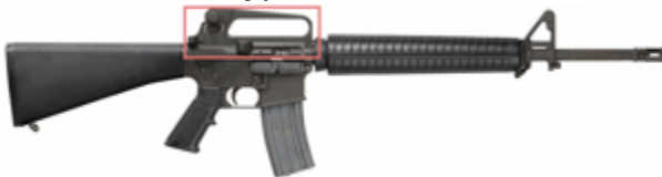
vue de droite