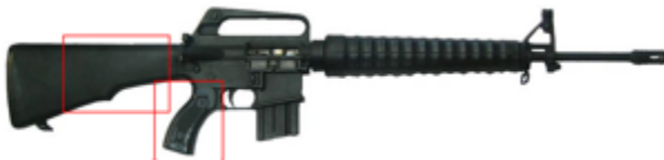
Type: NORINCO CQ (CHN)

vue de droite. Le TERAB fusil est un clone du Norinco CQ produit par le MIC (société d'industrie militaire) du Soudan. L'ARMADA fusil est un clone du Norinco CQ produit par S.A.M. (Shooter's Arms Manufacturing, a.k.a. Shooter's Arms Guns & Ammo Corporation) aux Philippines.