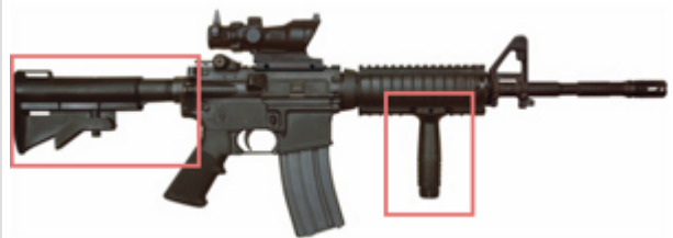
vue de droite