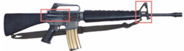
vue de droite