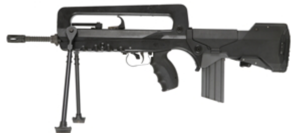
vue de gauche