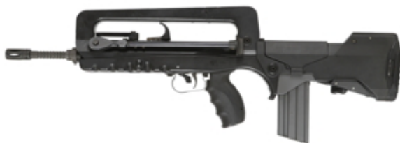
vue de gauche