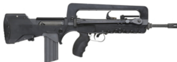
vue de droite