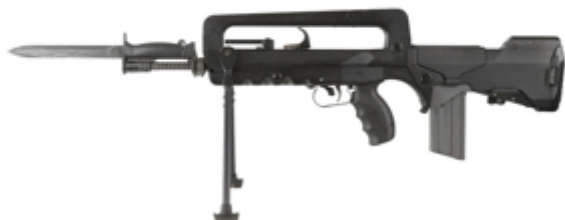
vue de gauche