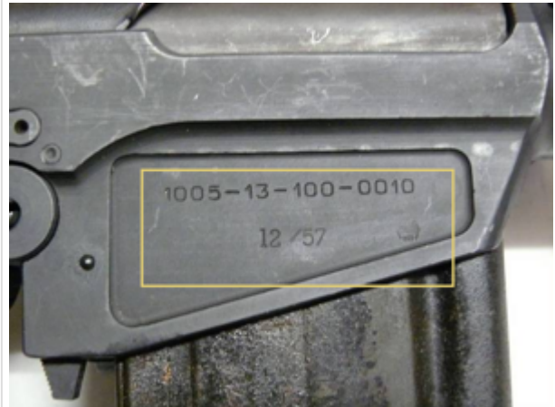
Fabriqué pour les forces armées allemandes