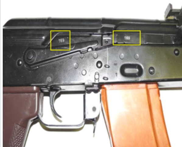
marquages (RDA carabine)

The following ammunition can be used by the AK-74 :