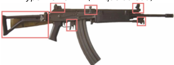
vue de gauche, cette version ressemble beaucoup aux fusils d'assaut Galil et Valmet