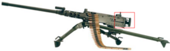
vue de gauche, Mitrailleurse Browning M2HB refroidie par air, sur trépied M3