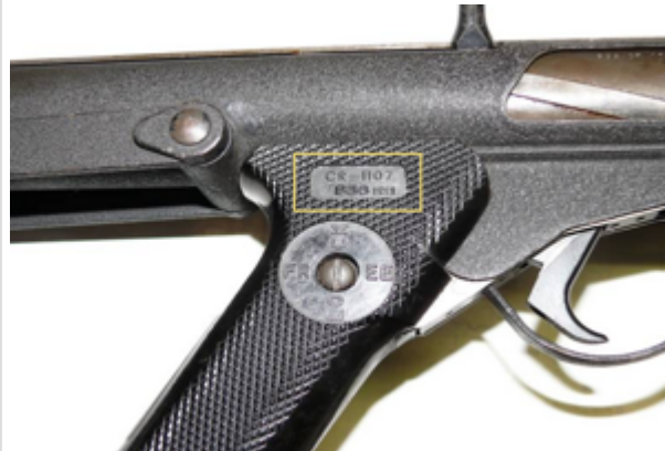
Sterling MP L2A3