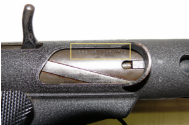
Sterling MP L2A3