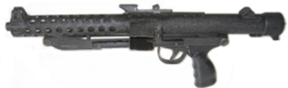
vue de gauche, ESP, mitraillette, 9 x 23 mm Largo