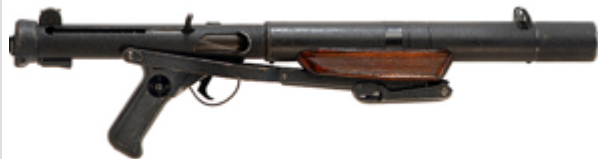
Version avec silencieux L34A1

vue de droite, Copie chilienne de la mitraillette Sterling avec des différences à l'extérieur, telle que la crosse escamotable en métal et l'absence du manchon du canon