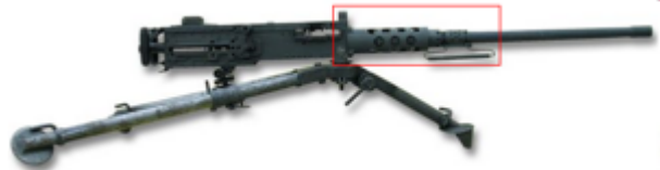
vue de droite, Mitrailleurse Browning M2HB-QCB refroidie par air de fabrication actuelle avec canon rapidement remplaçable, sur trépied M3