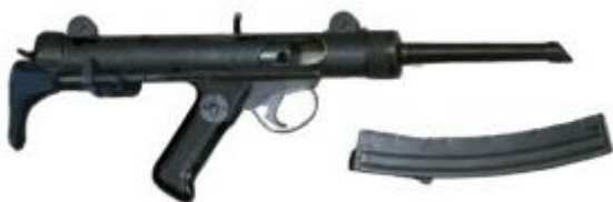
Type: FAMAE PAF 9 mm

vue de droite, Copie chilienne de la mitraillette Sterling avec des différences à l'extérieur, telle que la crosse escamotable en métal et l'absence du manchon du canon