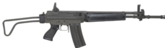
vue de droite