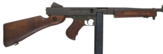
vue de droite