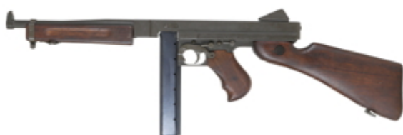
vue de gauche