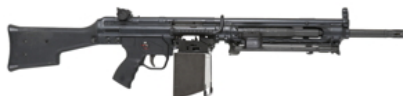
vue de droite