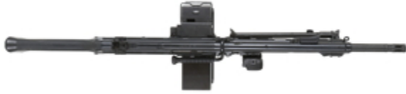
vue du dessus