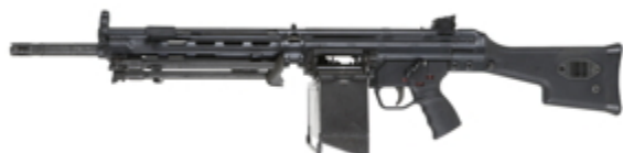
vue de gauche