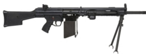
vue de droite