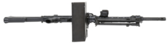
vue du dessous