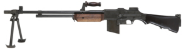
vue de gauche