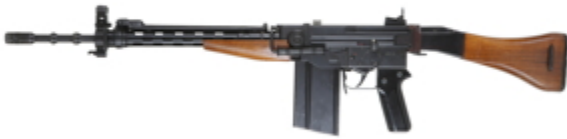
vue de gauche