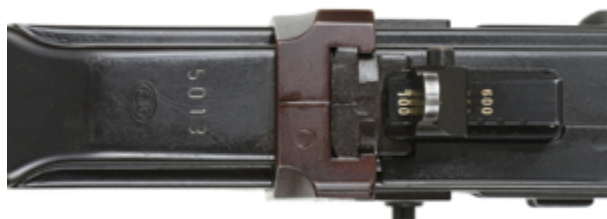
vue du dessus