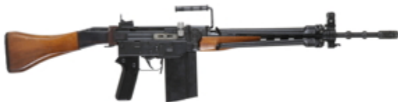
vue de droite