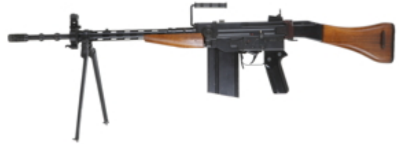
vue de gauche