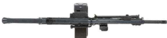
vue du dessus