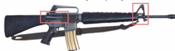
vue de droite