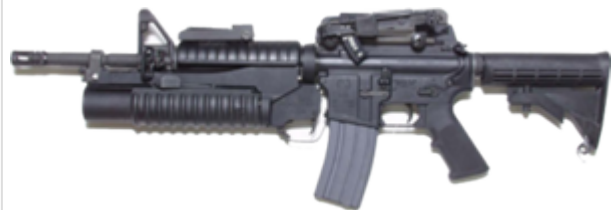
vue de gauche