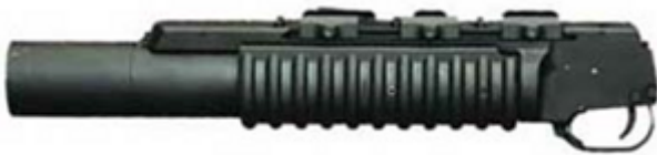
vue de gauche