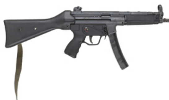
vue de droite