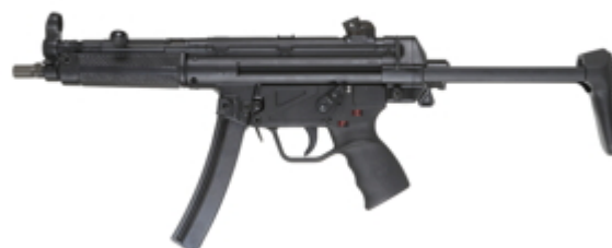
vue de gauche, crosse dépliée