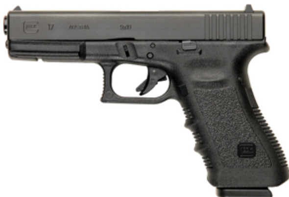
troisième génération de Glock 17

3ème génération Glock 17 avec des canelures pour les doigts, un évidement pour le pouce et un rail porte - accessoires sur la carcasse qui différencie ce modèle de la génération antérieure.