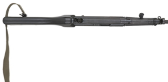
vue du dessus