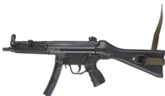
vue de gauche