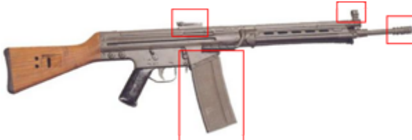
vue de droite, CETEME model B, le père du G3