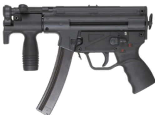
vue de gauche