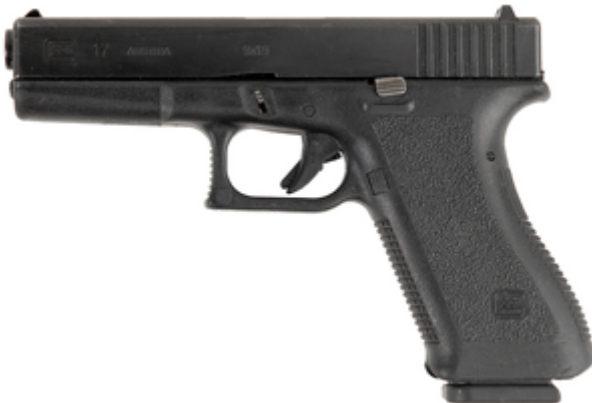
deuxième génération de Glock 17

Le deuxième génération est beaucoup plus facile de tenir que le premier génération de Glock 17