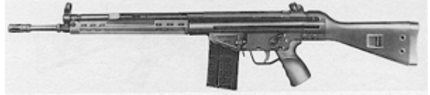
vue de gauche