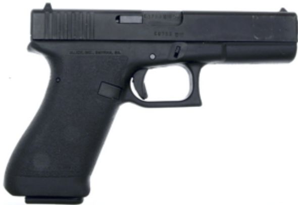
vue de droite