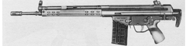
vue de gauche