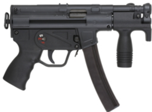
vue de droite