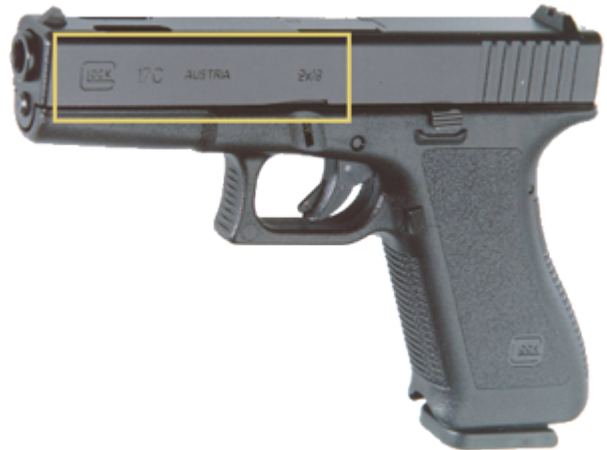
vue de gauche