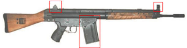
vue de droite