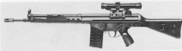
vue de gauche