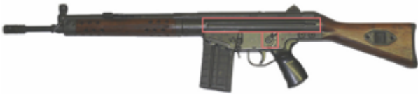
vue de gauche