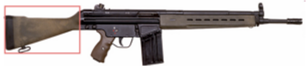
La crosse ressemble fort à celle du FN FAL