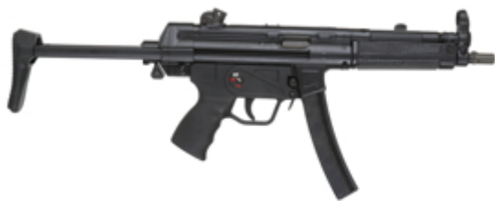
vue de droite