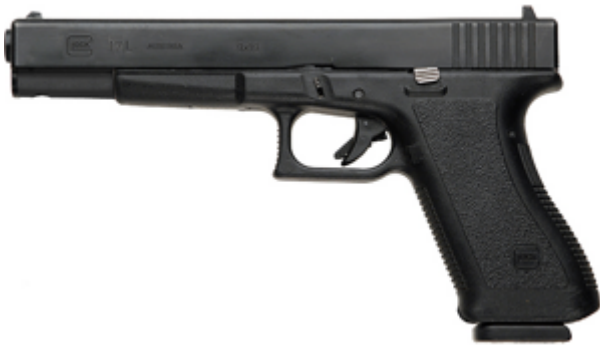
view de gauche