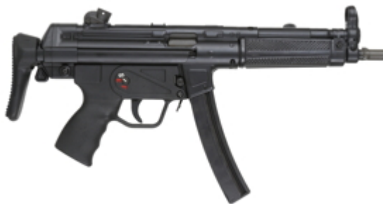
vue de droite