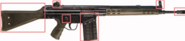
vue de droite